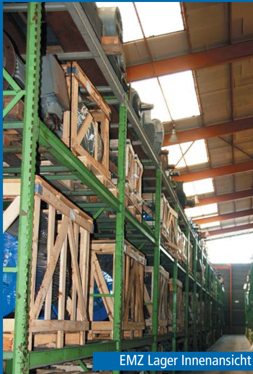
EMZ Lager Innenansicht